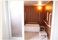
手すり完備の浴室